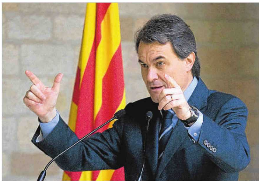
El presidente de la Generalitat, Artur Mas, ayer en su comparecencia en Palau

Las palabras de Salgado crearon sorpresa y malestar en el Go-