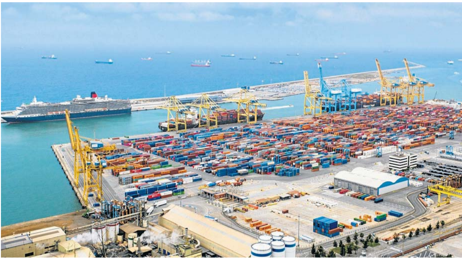
El port de Barcelona vist des del castell de Montjuïc. MANOLO GARCÍA