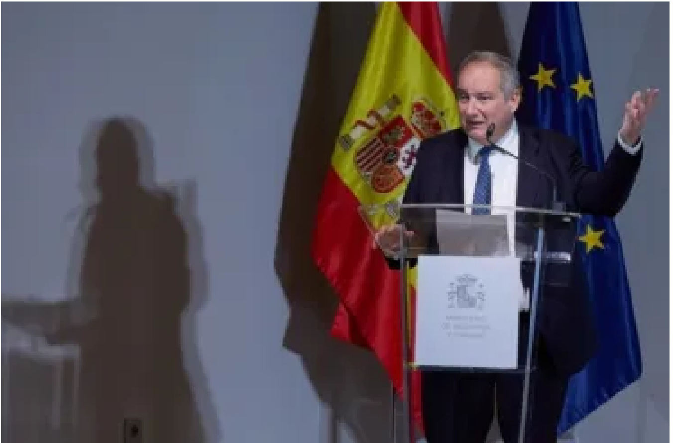
La catalana Semidynamics rep gairebé 40 milions del fons PERTE Xip