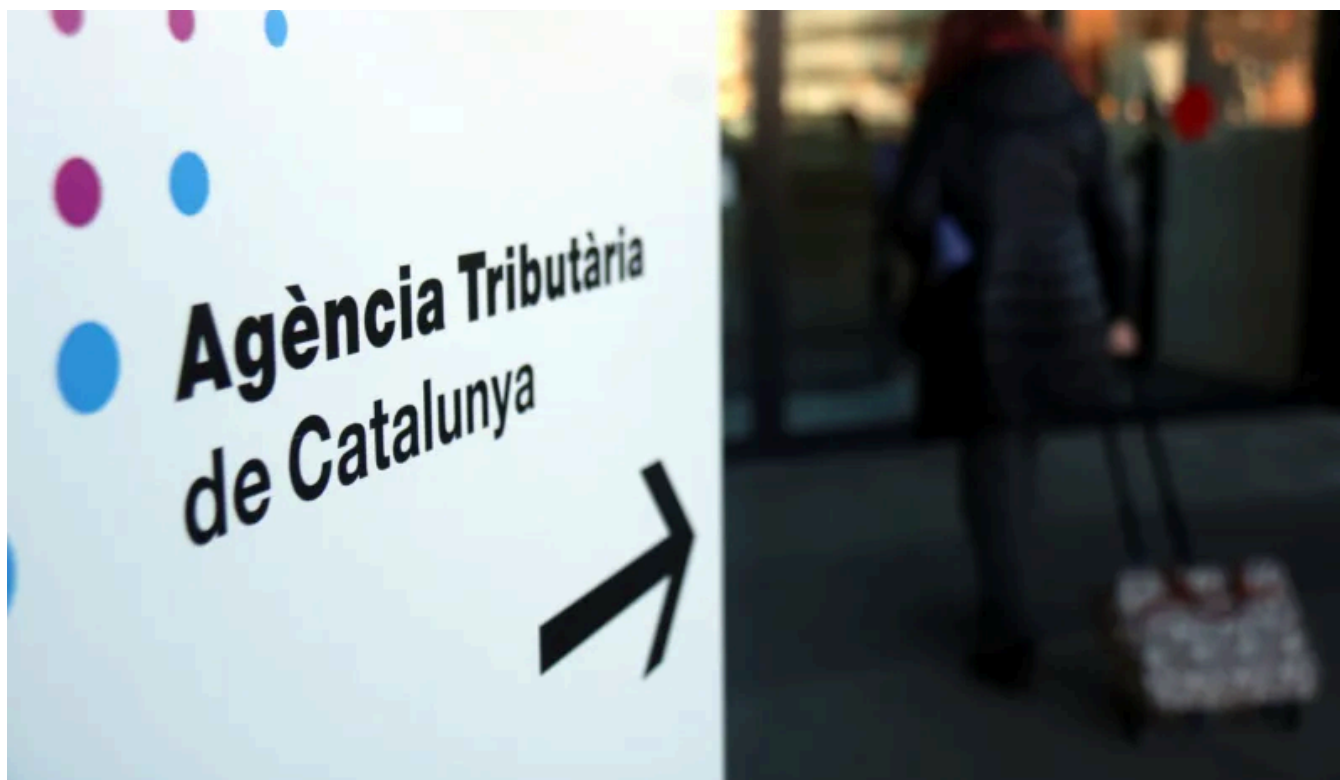
Imatge de l'Agència Tributària de Catalunya / ACN

Tal com recull l'article, amb el model actual, l'any 2022 el tresor públic va atraure poc més de 610,5 milions d'euros en concepte de Patrimoni, amb una mica més de 87.700 pagadors. En la simulació que plantegen Galí i Capella, amb un mínim de patrimoni exempt de 10 milions d'euros, el pagarien només 3.113 catalans. Amb només tres trams de base imposable, i sobre uns tipus respectius d'entre l'1 i el 2%, els economistes calculen que es podria mantenir aquest ritme d'ingressos, o fins i tot superar-lo en més de 130 milions si s'afegeix mig punt al tipus segon tram -1%-1,5%-2%- . D'aquesta manera, apunta el catedràtic, s'evitarien noves càrregues fiscals sobre els professionals d'alta qualificació, fent el territori més atractiu per al talent local i global; mentre que es posaria el conjunt de la càrrega impositiva sobre les fortunes més grans de Catalunya, que ara l'aconsegueixen esquivar gràcies a les esclatxes -intencionals- que el legislador va deixar a l'impost. El mateix Galí explica que s'aproxima a aquesta problemàtica arran de la marxa de "professionals d'alt nivell" al seu entorn personal. "He vist gent marxar a Londres, perquè aquí els massacren", comenta. Mentrestant, ironitza, "les grans fortunes del país viuen aquí".