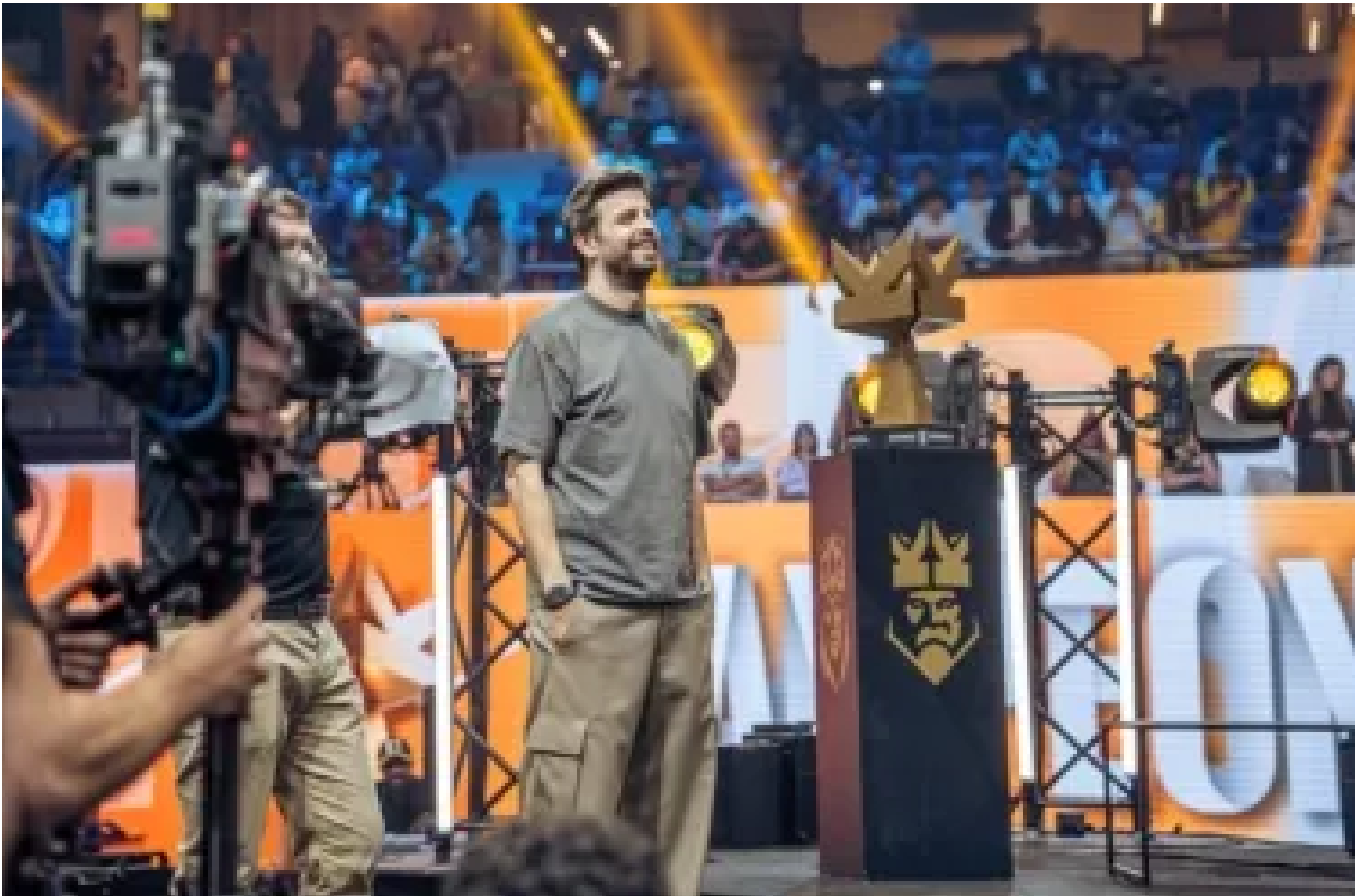
La Kings League de Piqué tanca una ronda de 60 milions