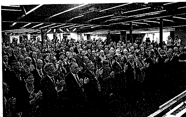
Una dotzena d'organitzacions de Foment han signat el Manifest del Far. P.T.